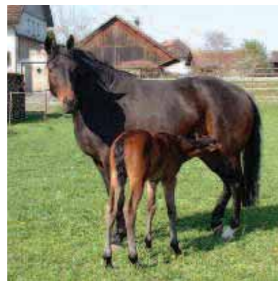
Tägliche Bewegung und der Kontakt mit dem Betreuer sind für die Gesundheit der Stute und die Entwicklung des Fohlens wichtig.

Bis zum 8. Lebensmonat ist das Fohlen auf ein hochverdauliches Futter angewiesen, weil die Verdauung im Dickdarm erst langsam einsetzt. Wegen des intensiven Wachstums und der enormen Muskelbildung braucht das Fohlen im ersten Lebensjahr eine proteinreiche Nahrung. Für die gesunde Skelettentwicklung ist die Zufuhr von Mineralstoffen (Ca, P, Mg, Na), Spurenelementen (Kupfer, Selen, Jod und Eisen) sowie Vitaminen (A, D, E, B-Komplex) unerlässlich. HYPONA 783/787 BIO werden den speziellen Bedürfnissen der Fohlen gerecht.